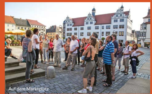
Auf dem Marktplatz

Stadtführungen täglich von Mai bis September durch eine der schönsten Renaissancestädte Deutschlands mit Besichtigung des Schlosshofes Treff: Torgau-Informations-Center, täglich 14 - 15 Uhr, Juni bis August auch Mo bis Fr 18 - 19 Uhr