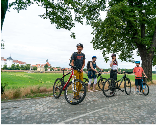
Torgau am Elberadweg

Auf dem Torgauer Marktplatz gibt es kein offizielles Rad-Leitsystem zu diesen drei Radwegen. Die Torgauer Ausschilderung des rechts- und linksseitigen Elberadweges erfolgt u.a. am Bahnhof, an der Elbbrücke, am Denkmal der Begegnung und am Brückenkopf. Die Torgauer Ausschilderung des Lutherwegs erfolgt u.a. am Brückenkopf. Die Torgauer Ausschilderung des Torgischen Wegs erfolgt ab dem Marktplatz nur in Form von grünen Pfeilen ohne jede ersichtliche Namensangabe. Erst am Denkmal der Begegnung und am Bahnhof gibt es Infotafeln zu diesem Radweg mit Logo. Die Torgauer Abschnitte (Radwegelag) dieser drei Radwege sind teilweise geteert, bisweilen mit Splitt und geschlämmtem Sand befestigt oder in wenigen Passagen gepflastert.