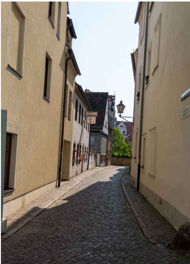
Kopfsteinpflaster in Torgau – Blick in die Katharinenstraße

Die historische Altstadt von Torgau ist geprägt von Kopfsteinpflaster. Hier gilt es entsprechend vorsichtig zu fahren, besonders bei Nässe.