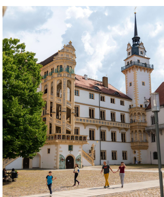
Großer Wendelstein