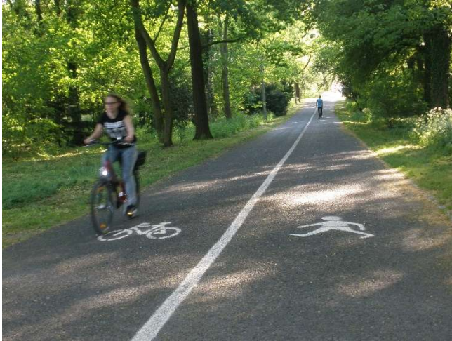
Glacis Rapitzweg

Besondere Merkmale: Die Devise im Glacis-Bereich lautet „Geselligkeit“. Alle Benutzer nehmen aufeinander Rücksicht. Der Glacis-Promenadenring soll der gemütlichen Fortbewegung und somit der Entspannung für alle nichtmotorisierten Benutzer dienen. Radfahrer müssen auf andere Benutzer Rücksicht nehmen!