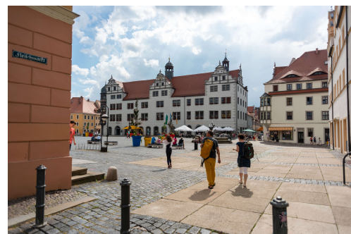
Torgauer Marktplatz

Mit einem unterbrochenen grünen Strich sind auf dem Stadtplan die nicht ausgeschilderten Rad-Haupttrouten in der Innenstadt (R 1- R 4) markiert. Diese führen vom Torgauer Zentrum, Richtung Bahnhof, Richtung Glacis, Richtung Elbe und Richtung Außenbezirk oder umgekehrt. Es handelt sich hier um vier empfohlene Rad-Routen des ADFC, die alle zwischen 1 und 2 Kilometer lang sind. Bitte seien Sie besonders vorsichtig beim Queren von stark befahrenen Straßen, bei Auffahrten, Einbiegungen und bei Passagen mit Kopfsteinpflaster.