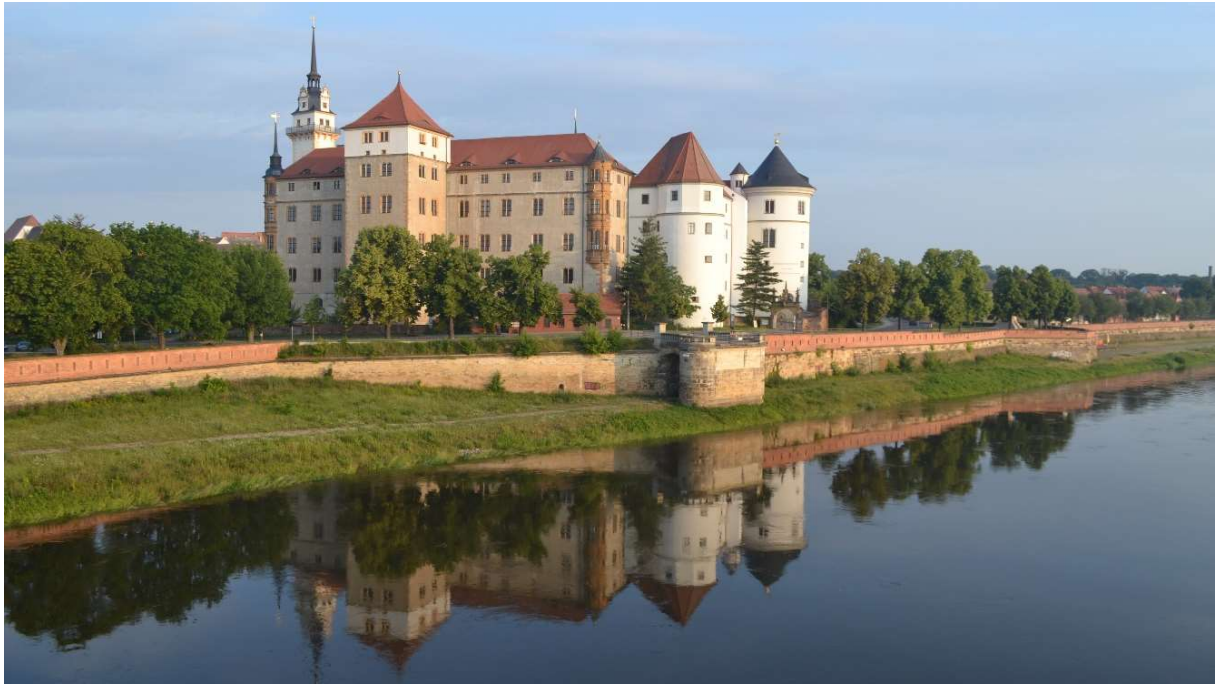
Schloss Hartenfels