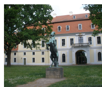
Gestüt Graditz