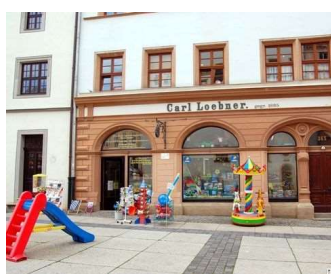
Spielwarengeschäft Carl Loebner