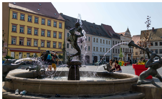
Torgauer Marktplatz

V2 Torgauer Ratsforst -NSG Großer Teich - Thomas Müntzer Straße - Überquerung Friedrich Naumann Straße (B 182) - Fahrradstraße Rapitzweg – Überquerung Südring - Leipziger Straße (unterer Teil) - Straße der Jugend-Promenade (Förderschule) - Erzenstraße (geöffnete Einbahnstraße in Gegenrichtung) - Leipziger Straße (oberer Teil) - Breite Straße- Scheffelstraße - Torgau Markt