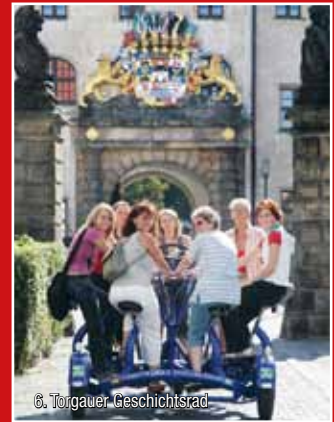
6. Torgauer Geschichtsrade