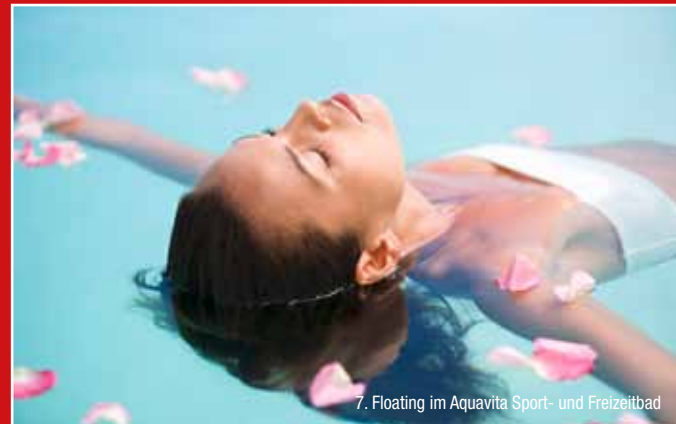
7. Floating im Aquavita Sport- und Freizeitbad

inkl. Eintrittsgelder, Preis gilt ab 2 Teilnehmer