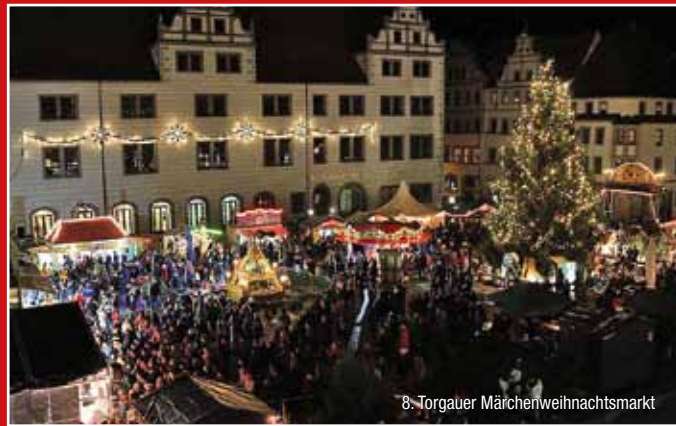
8. Torgauer Märchenweihnachtsmarkt

Wenn Sie Lust und Zeit zum Reisen haben, schauen Sie auf unserer Seite www.tic-torgau.de , was es Neues für Sie gibt!