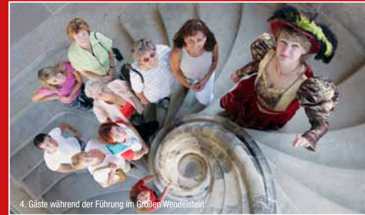
4. Gäste während der Führung im Großen Wendelstein