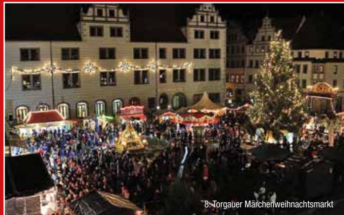
8. Torgauer Märchenweihnachtsmarkt

Wenn Sie Lust und Zeit zum Reisen haben, schauen Sie auf unserer Seite www.tic-torgau.de , was es Neues für Sie gibt!