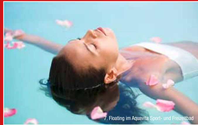
7. Floating im Aquavita Sport- und Freizeitbad

inkl. Eintrittsgelder, Preis gilt ab 2 Teilnehmer