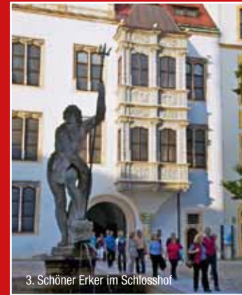
3. Schöner Erker im Schlosshof