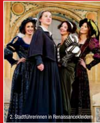
2. Stadtführerinnen in Renaissancekleidern