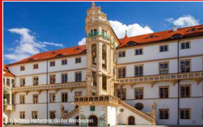
1. Schloss Hartenfels, Großer Wendelstein